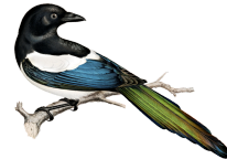
photo d'une pie